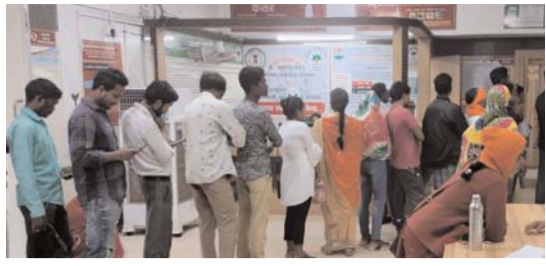
प्रिंटेड से अधिक में बिक रहा आई फ्लू का ड्रॉप महंगे में बिक रहा सिप्लाक्स, मॉक्सिप्लाक्सिन, जेंटोलेब व मौक्सो आई ड्रॉप

जगदलपुर (कुबेर भूमि)। संभागीय मुख्यालय में शासकीय जिला महारानी अस्पताल में एक दिन में लगभग 70 फीसदी आई फ्लू पहुंच रहे हैं, जिसके लिए अस्पताल प्रबंधन की ओर से सिप्लाक्स, सिप्रोफ्लोक्सिन आदि दवा के आई ड्रॉप निशुल्क मिल रहे हैं। वहीं दूसरी ओर निजी क्लीनिक में इलाज कराने वालों को आई फ्लू की आई ड्रॉप निजी मेडिकल स्टोर में महंगे में बिक रही है। इसमें ड्रॉप प्रिंटेड से अधिक में मरीजों को मिल रहा है। मेडिकल स्टोर में सिप्लाक्स 15.34 को 50 रूपए, 86.90 को मौक्सोप्लाक्सिन 100 रूपए, 48.31 को जेंटोलेब 60 रूपए एवं 160 को मौक्सो आई ड्रॉप 200 रूपए में बिक रही है। शनिवार को शासकीय अवकाश होने के बाद भी महारानी अस्पताल में आपातकालीन सेवा में इलाज कराने के लिए मरीज कतारबद्ध लगे रहे। शहर के महारानी अस्पताल, डिमरापाल स्थित मेडिकल कॉलेज एवं ग्रामीण क्षेत्र के उप स्वास्थ्य केन्द्र में सिप्लाक्स, सिप्रोफ्लोक्सिन के आई ड्रॉप निशुल्क मिल रहा है।