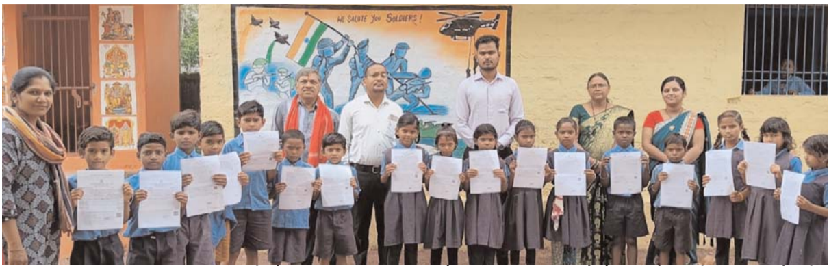
एक ही दिन में 6 हजार से ज्यादा प्रमाण पत्रों का वितरण